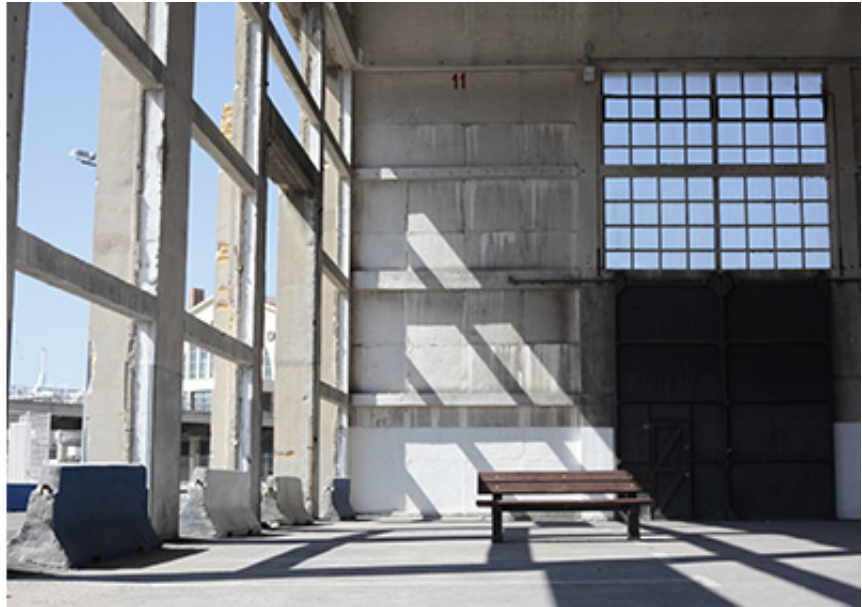
started in 2016