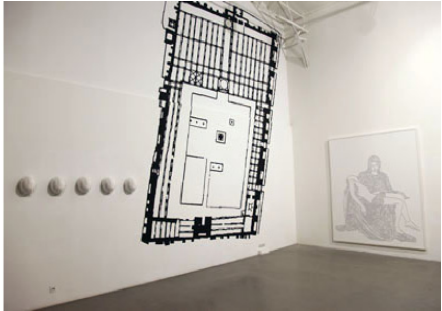
2009-2010, black acrylic painting, in situ. Exhibition view from Seeing is believing, Galerie Hussenot, 2010, Paris.

« La Mosquée » est une série de peintures murales qui reproduit en noir et blanc les plans architecturaux des mosquées traditionnelles, combinaison irrégulière de formes rectangulaires et légèrement inclinée par rapport au sol. Son esthétique rappelle celle du projet « Le Changement fondamental », succession graphique et chronologique de différents plans architecturaux, depuis ceux de mosquées construites au 9 e siècle, jusqu'au plans des musées apparus dans les années 2000.