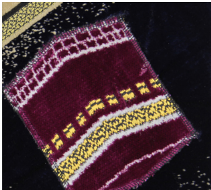
2012, collage with prayer rugs on canvas, 40 x 40 cm. Exhibition view from Pictorial Field, D+T Project Gallery, 2013, Brussels.