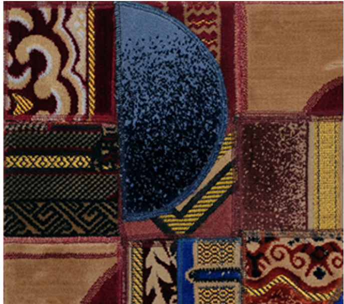
2023-2024, collage with prayer rugs on canvas, 40 x 40 cm.