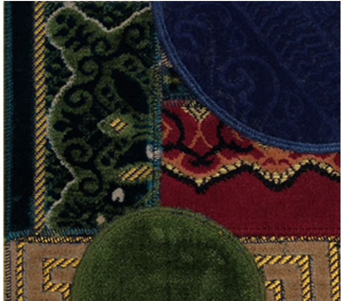
2023-2024, collage with prayer rugs on canvas, 30 x 30 cm. Courtesy of the artist.