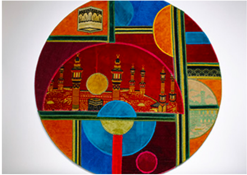
2016, collage with prayer rugs on canvas, diameter 100 cm

Dès les VII e et VIII e siècles, les savants islamiques développaient des outils novateurs s'appuyant sur la science, les mathématiques et l'ingénierie. De magnifiques schémas et dessins représentant des roues, engrenages, machines, objets astronomiques ou optiques et pour d'autres usages, accompagnés de leurs textes et annotations, apparaissent dans les exemples les plus anciens de livres et manuscrits de cette époque. Durant cet Âge d'or islamique, ces savants étaient à la pointe de la technologie et de l'innovation, un riche héritage qu'on oublie souvent dans nos sociétés contemporaines. Inspiré en partie par ces images, Mounir Fatmi a commencé à explorer la relation entre la machine, la culture et la religion à travers un corpus d'œuvres comprenant de grandes installations vidéo telles que Temps Modernes et Technologia, et cette série de neuf collages sur toile, œuvres intitulées Mécanisation.