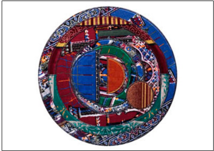
2011, collage with prayer rugs on plywood, 70 cm.

Dès les VII e et VIII e siècles, les savants islamiques développaient des outils novateurs s'appuyant sur la science, les mathématiques et l'ingénierie. De magnifiques schémas et dessins représentant des roues, engrenages, machines, objets astronomiques ou optiques et pour d'autres usages, accompagnés de leurs textes et annotations, apparaissent dans les exemples les plus anciens de livres et manuscrits de cette époque. Durant cet Âge d'or islamique, ces savants étaient à la pointe de la technologie et de l'innovation, un riche héritage qu'on oublie souvent dans nos sociétés contemporaines. Inspiré en partie par ces images, Mounir Fatmi a commencé à explorer la relation entre la machine, la culture et la religion à travers un corpus d'œuvres comprenant de grandes installations vidéo telles que Temps Modernes et Technologia, et cette série de neuf collages sur toile, œuvres intitulées Mécanisation.