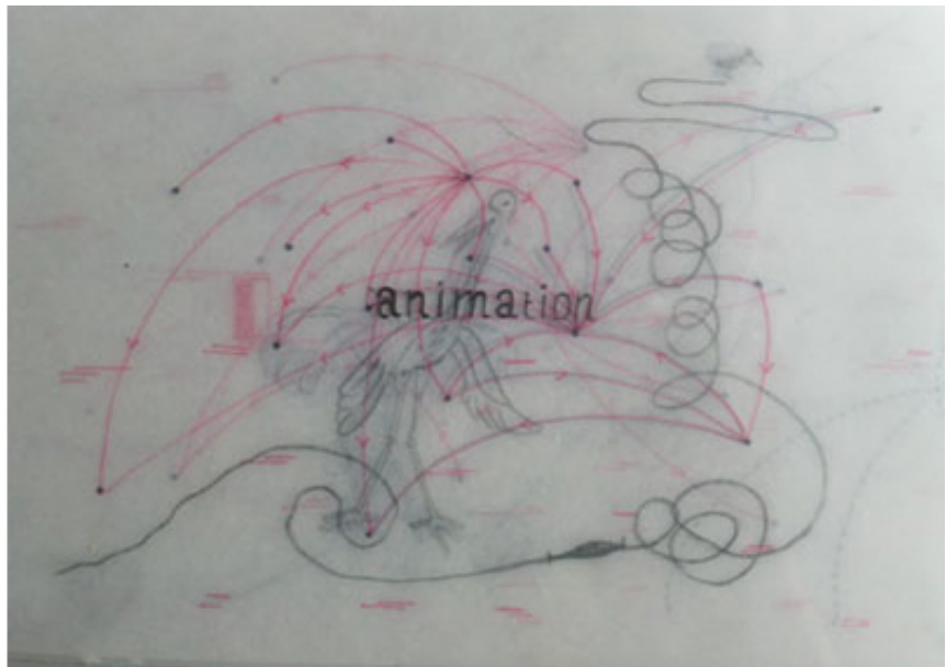
1998-1999, drawings on laminated layer, serie of 74 pieces, 30 x 21,5 cm. Exhibition view from Paris-Casa, suites marocaines, Couvent des Cordeliers, 1999, Paris. Artist's collection.

« Animation » regroupe une série de dessins commencée en 1998, dont le projet doit aboutir à une animation vidéo. Réalisées sur papier stratifié, des compositions graphiques dont les couleurs sont principalement le rouge, le noir et le blanc, traversent les pages blanches avec des inflexions filaires, exécutant des séries de courbes et de boucles qui s'entortillent à la manière d'un câble électrique ou d'un cordon ombilical, et auxquelles se superposent les fines silhouettes de cigognes ainsi que divers noms de pays. L'association de ces trois couleurs est typique du dessin de mounir fatmi et elle tend à former un code chromatique à la fois symbolique et émotionnel, où le rouge est la couleur du lien, le blanc celle de la séparation ou de l'oubli et le noir, celle qui permet de donner une forme au moins provisoire à des apparitions graphiques instables et fragiles, parfois proches de l'évanescence.