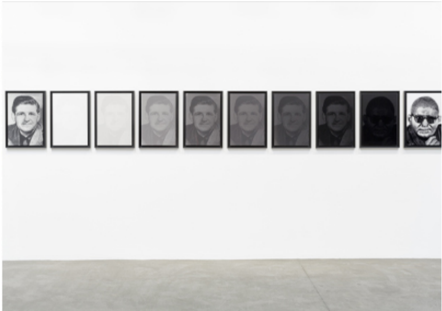
Under the Skin, SFpublishing 2024