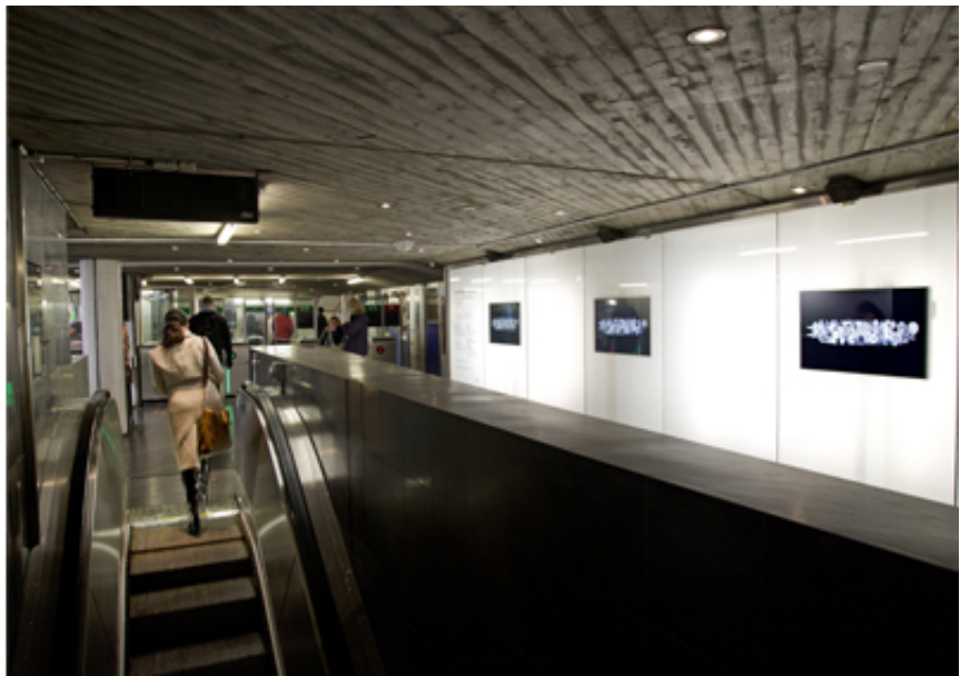
A matter of perception, SFpublishing 2024