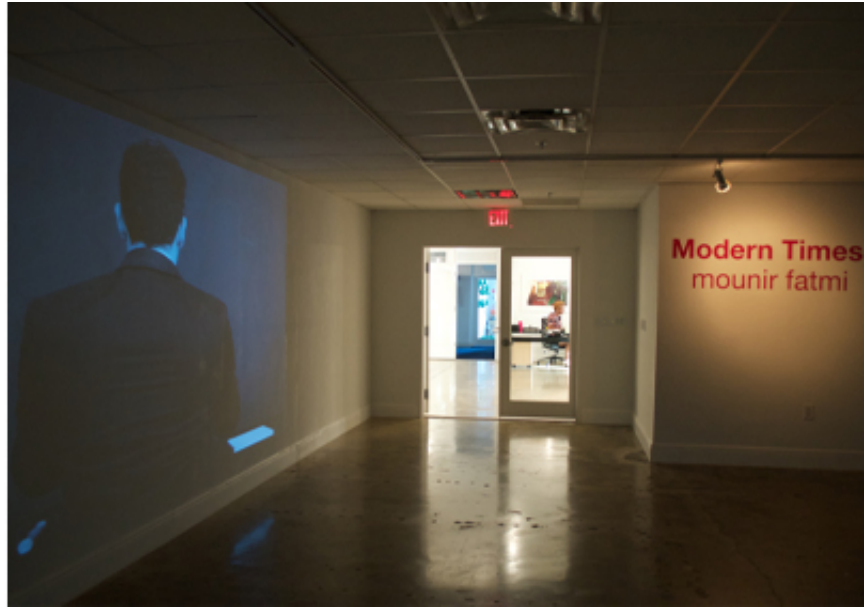
Modern Times, SF Publishing 2024