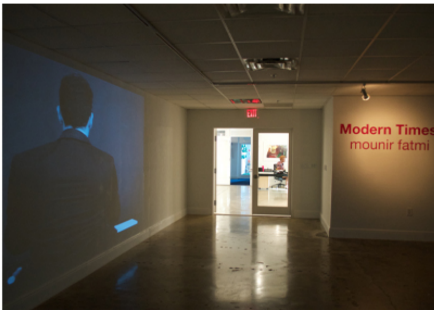
Modern Times, SF Publishing 2024