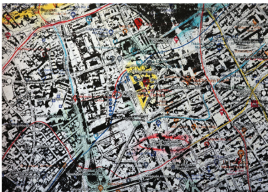
100 mètres à vol d'oiseau, SFpublishing 2023