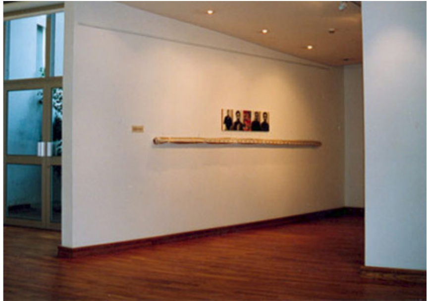
1998, painting on canvas wrapped in plastic, photographs. Exhibition view from Rien à voir, fondation Actua, 1998, Casablanca. Courtesy of the artist and Ceysson & Benetiere, Paris.

La sculpture Coma se compose de longs tubes surmontés de portraits photographiques de spectateurs anonymes. Pour la réalisation de cette oeuvre Mounir Fatmi a réuni quelques unes de ses premières compositions picturales, proches de l'abstraction et de la figuration libre, ayant connu une reconnaissance critique et un certain succès à l'international. Chaque peinture est montrée à un petit groupe de spectateurs convoqués comme témoins. Une fois vues, les peintures sont enroulées sur elles-mêmes, emballées dans des housses en plastique transparent et scellées au moyen de rubans adhésifs. Sous forme de tube, chaque toile est ensuite accrochée aux murs de la galerie et surmontée de portraits photographiques des spectateurs ayant eu l'occasion de la voir avant son conditionnement.