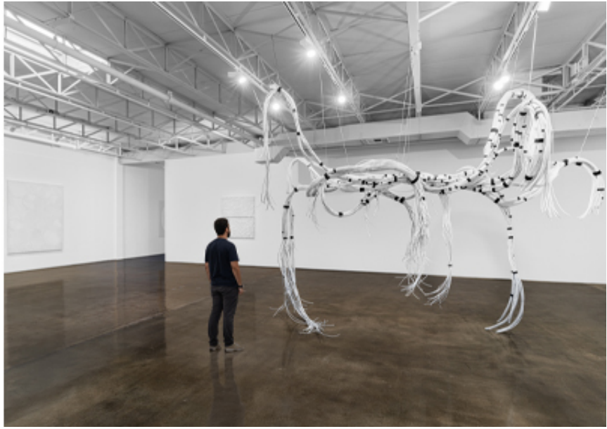
Whispered Stories of Forgotten Wires, SFpublishing 2023