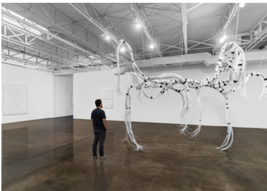
Whispered Stories of Forgotten Wires, SFpublishing 2023