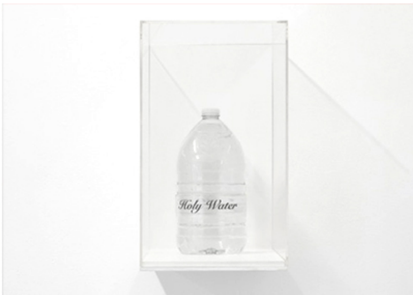
2018, Water bottle, rhodium-glass, plexiglass. Courtesy of the artist. Ed. of 25 + 1 A.P.