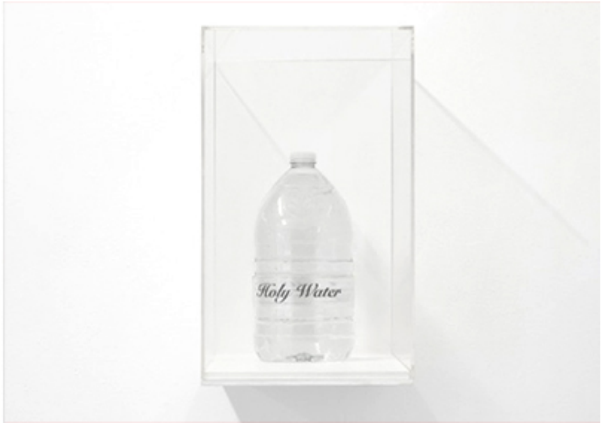
2018, Water bottle, rhodium-glass, plexiglass. Ed. of 25 + 1 A.P.