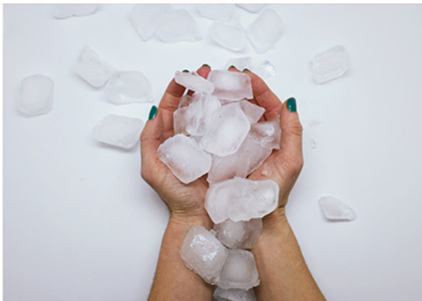
2014-2018, Print on glossy paper, 30 x 43 cm. Ed. of 500 + 1 A.P.