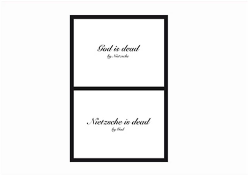
2012, Silk print on paper, 60 x 40 cm.