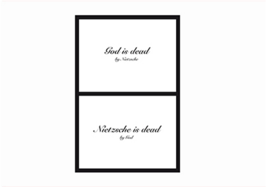
2012, Silk print on paper. Courtesy of the artist.