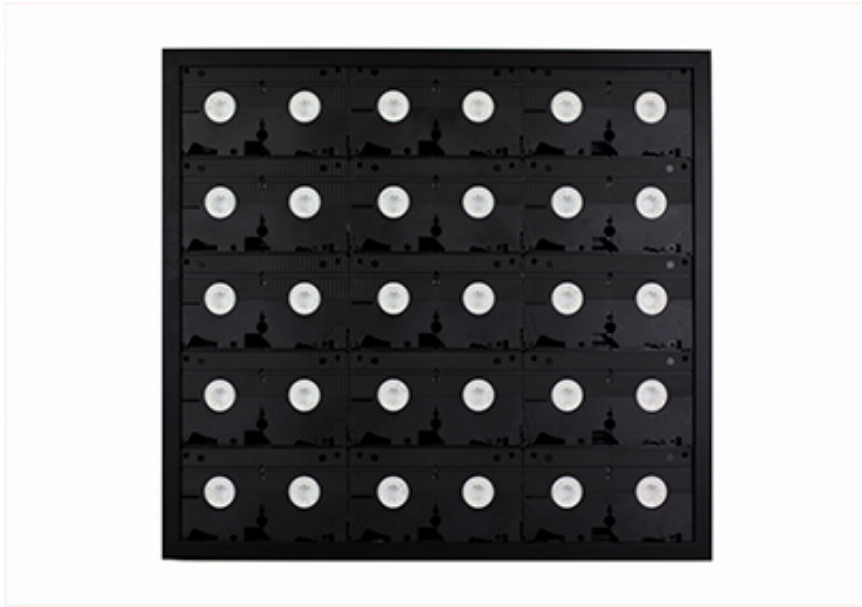
2011, Blank VHS tapes, 61 x 57 cm. Ed. of 15 + 1 A.P.