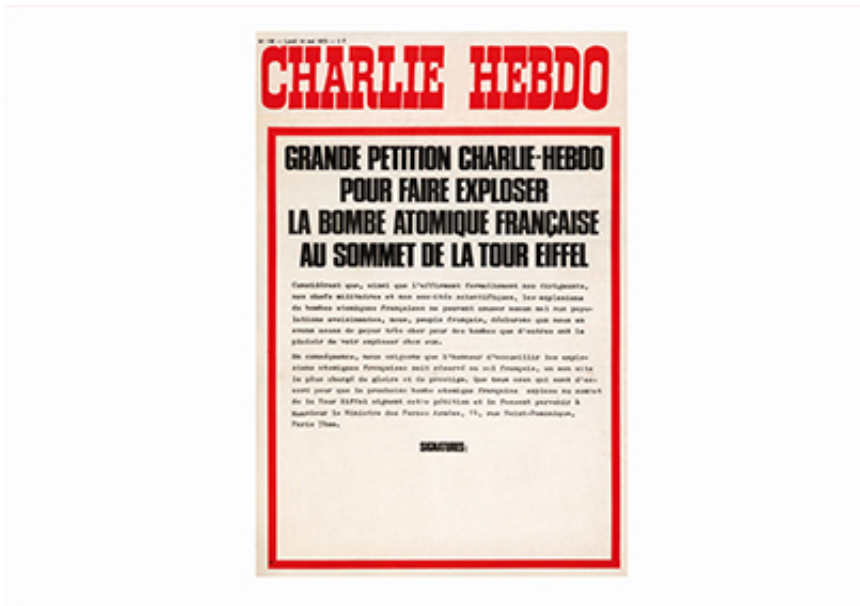
2009, Inkjet Print, 39,5 x 27,5 cm. Ed. of 50 + 1 A.P.