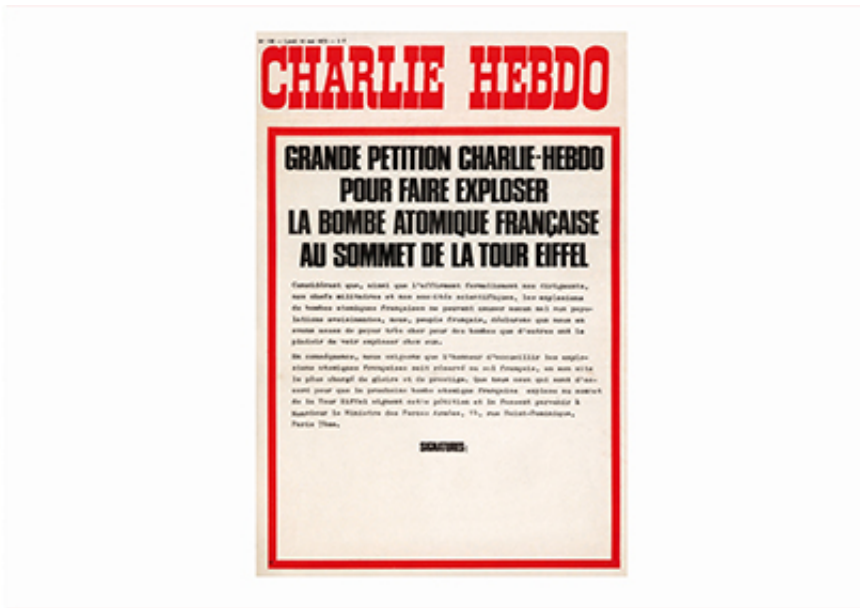
2009, Inkjet Print, 39,5 x 27,5 cm. Ed. of 50 + 1 A.P.