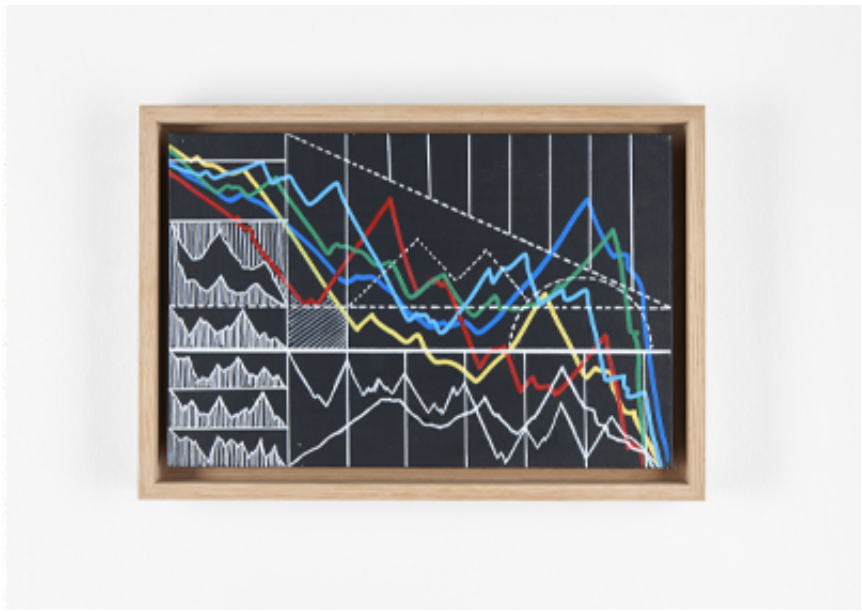
2020, Acrylic on canvas, 20 x 30 cm.

Depuis le début de sa recherche artistique, mounir fatmi s'est inspiré des signes et des formes calligraphiques arabes. La découverte des peintures de Brion Gysin à Tanger dans les années 80, lui a permis de voir ces dernières sous un autre angle, celui d'un langage universel. En 2014, il associe à ces formes calligraphiques d'autres dessins géométriques inspirés cette fois des courbes de la bourse. Il découvre ainsi cet alphabet abstrait et complexe qui constitue le langage économique. Il commence alors la série de dessins et de peintures, « Calligraphies de l'inconnu ». Déclarant : "Pour comprendre le monde, il faut prendre le pouls des marchés financiers, mais aussi des marchés aux puces."