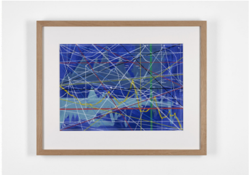
2020-2022, Acrylic on paper, 46 x 32,5 cm. Courtesy of the artist.