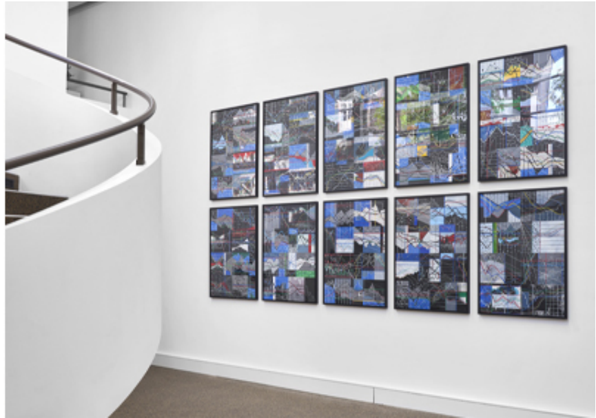
The Point of No Return, mounir fatmi, SF Publishing, 2022