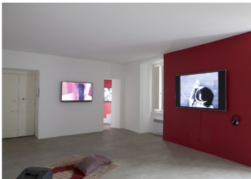
Yesterday was a terrible day, mounir fatmi, SF Publishing, 2022