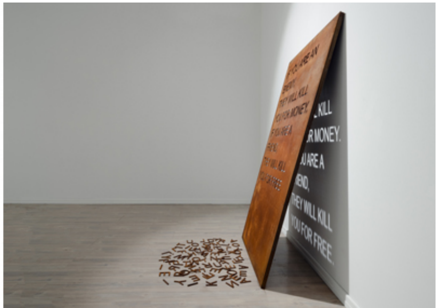
The Age of Consequences, mounir fatmi, SF Publishing, 2021, Hard cover