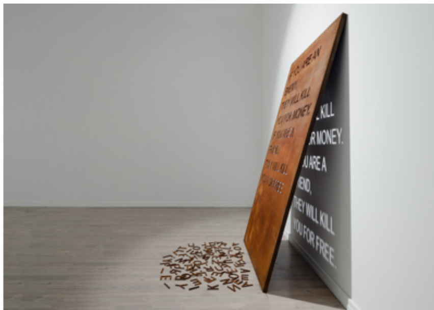
The Age of Consequences, mounir fatmi, SF Publishing, 2021, Hard cover