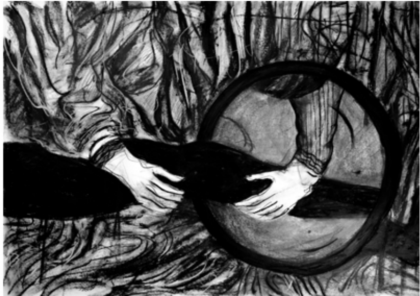
The Blinding Light, mounir fatmi, SF Publishing, 2021