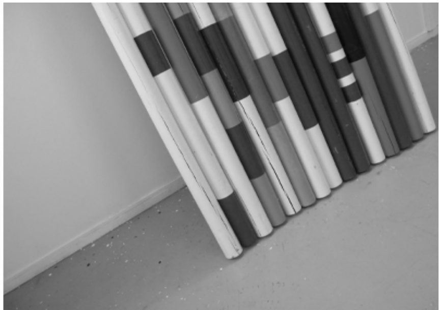
In Search of Paradise, mounir fatmi, SF Publishing, 2021