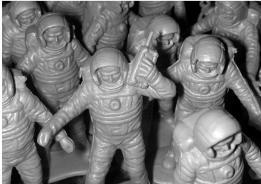
Hard Head, mounir fatmi, SF Publishing, 2021