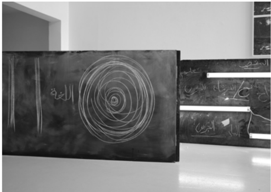
La Ligne Droite, mounir fatmi, SF Publishing, 2021