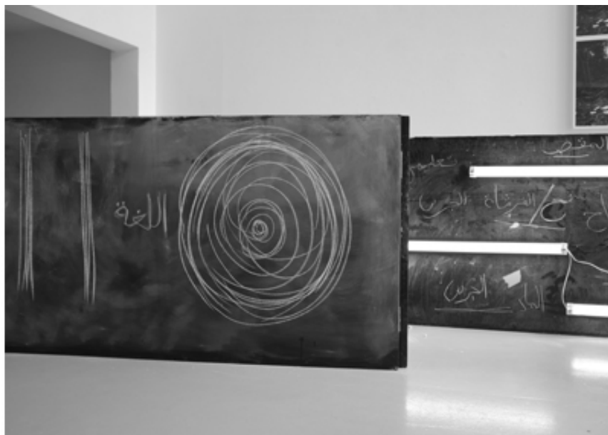
La Ligne Droite, mounir fatmi, SF Publishing, 2021