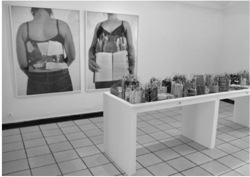
Connexion, mounir fatmi, SF Publishing, 2021