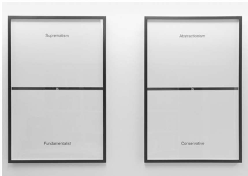
Light and fire, mounir fatmi, SF Publishing, 2021