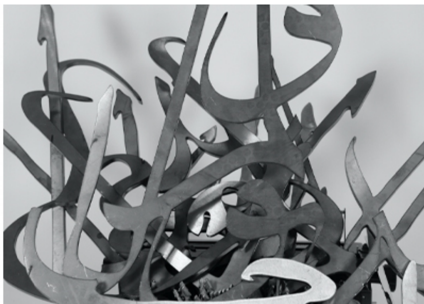
Intersections, mounir fatmi, SF Publishing, 2020