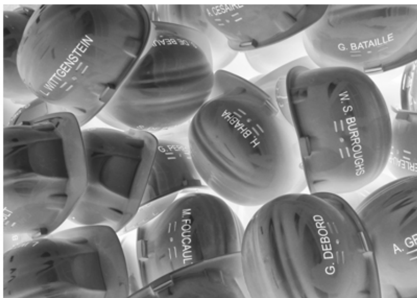
Ghosting, mounir fatmi, SF Publishing, 2020