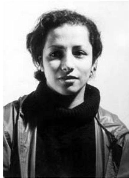
Serie started in 1996, photographs, silver print, various size. Exhibition view from Rien à Voir, Fondation Actua, 1999, Casablanca. Ed. of 5 + 2 A.P.

En 1998, Mounir Fatmi commence la série de portraits photographiques Témoins qui consiste à lier, sous la forme d'un contrat moral, le regardeur d'une œuvre à l'artiste. Leur relation se tisse à partir d'une question : « que fais tu dans la vie ? » réponse : « artiste ».