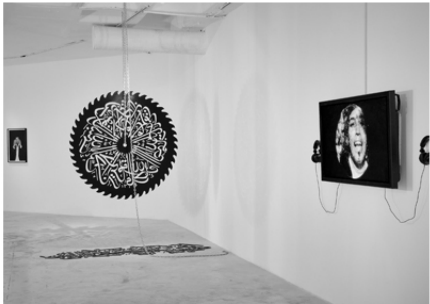
Fragmented Memory, mounir fatmi, SF Publishing, 2020