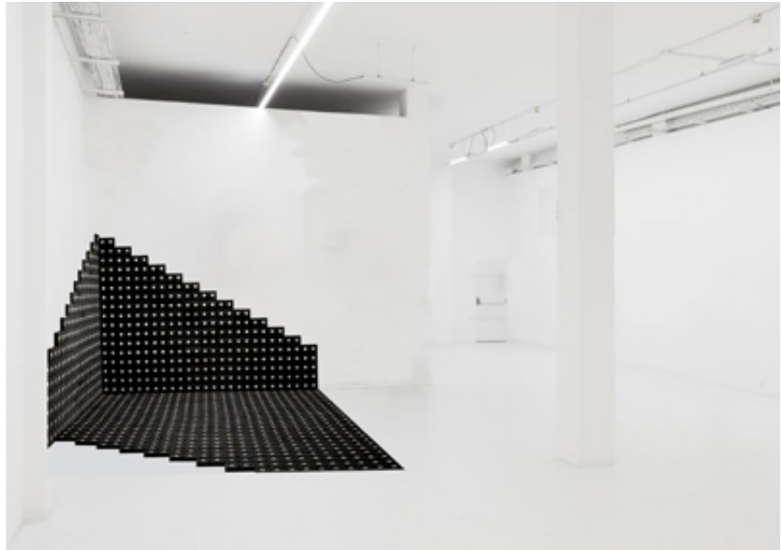
2021, VHS, size may vary. Exhibition view from The Observer Effect, ADN Galleria, 2021, Barcelona. Ed. of 5 + 1 A.P.

L'installation « Already Dead » est composée de centaines de cassettes VHS qui tapissent les murs et recouvrent le sol de l'espace d'exposition. La multiplication de ces éléments et l'aspect inachevé de l'œuvre donnent au spectateur l'impression d'un processus en cours, d'un recouvrement progressif de l'espace d'exposition. Comme un corps vivant qui se répand sur les murs à la manière d'un blob, forme de vie à la nature incertaine et dont les facultés d'adaptation et de croissance surprennent le monde scientifique.