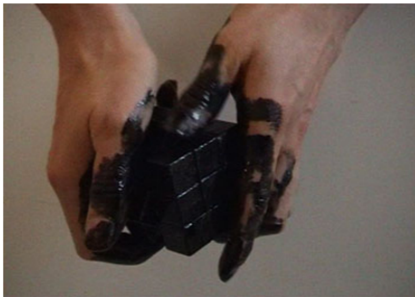
2004, France, 6 min 50, SD, 4/3, color, stereo. Courtesy of the artist and Ceysson & Bénétière, Paris. Ed. of 5 + 2 A.P.

This work was part of 24th biennial memorial of Nadezda Petrovic, Serbia, 2007.