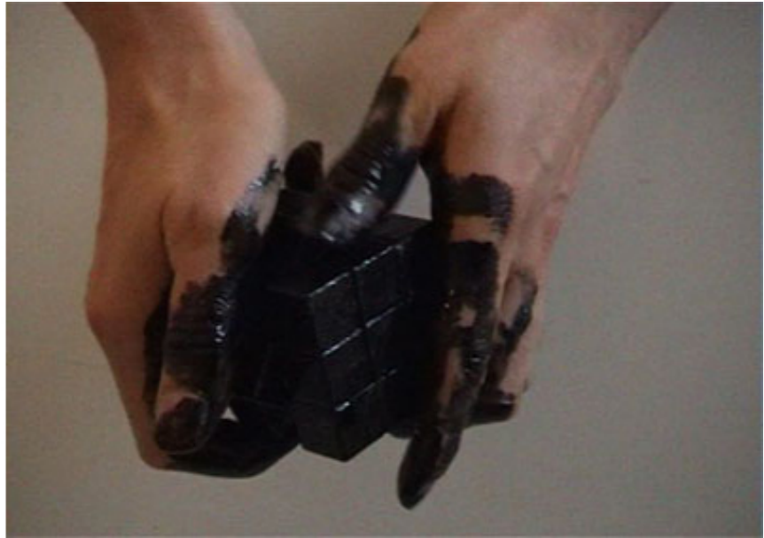
2004, France, 6 min 50, SD, 4/3, color, stereo. Courtesy of the artist and Ceysson & Bénétière, Paris. Ed. of 5 + 2 A.P.

This work was part of 24th biennial memorial of Nadezda Petrovic, Serbia, 2007.