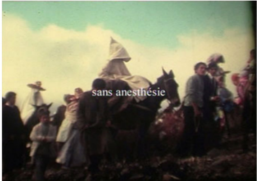
2003, Morocco, France, 12 min 07, SD, 4/3, color, stereo. Ed. of 5 + 2 A.P.

Dans Les Ciseaux (2003), Mounir Fatmi monte les scènes d'amour censurées du film Une minute de soleil en moins , réalisé par Nabil Ayouch la même année. Mounir Fatmi réalise donc à son tour un film d'amour, mais d'amour pour les images. Les Ciseaux met en scène les enlacements entre un homme et une femme, et plus largement des étreintes : 1) entre un film défait ( Une minute de soleil en moins ) et un film de sauvegarde ( Les Ciseaux ) ; 2) entre l'idéologie qui a censuré les scènes (l'intégrisme marocain) et la nappe discursive qui leur permet de revenir à la lumière (le texte d'Alfred de Musset, symbole populaire du discours d'amour, puisqu'on l'apprend à tous les enfants au sein de l'école républicaine) ; 3) entre les destructeurs et les créateurs d'un film. Car le concept consiste à englober les éléments absents du dispositif : « c'est devenu aussi un film documentaire mais en collaboration avec les intégristes marocains et les censeurs, puisque ce sont eux qui ont décidé des coupures ».