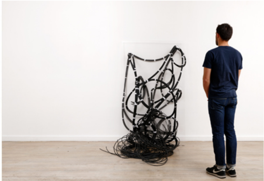
2019, transparent plexiglass, 500 m black antenna cable, 180 x 110 x 130 cm. Exhibition view from The White Matter, Ceysson & Bénétière, 2019, Paris.

La sculpture Transition 01 est réalisée à l'aide de câbles d'antenne noirs, rassemblés par du ruban autoagrippant blanc. Les câbles passent au travers d'une plaque de plexiglas transparente épaisse percée de plusieurs trous et posée contre un mur. Ils décrivent un réseau de boucles enchevêtrées qui se répandent depuis le mur jusqu'au sol.