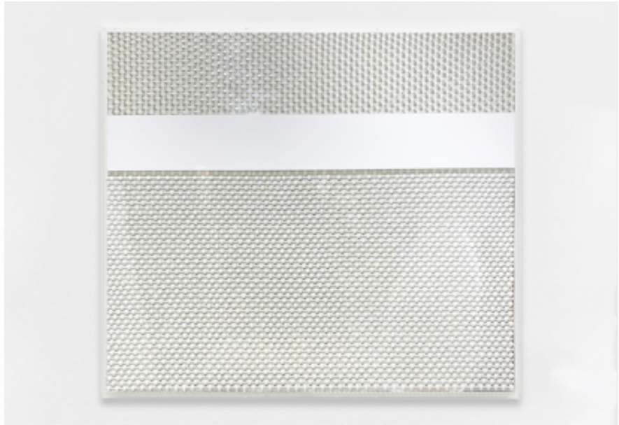
2019, coaxial antenna cable and staples on wood, 80 x 80 cm.

« White Matter » est une série de sculptures réalisée au moyen de câbles coaxiaux blancs agrafés à des panneaux de bois où ils forment des réseaux aux mailles étroites, ou reliant plusieurs panneaux entre eux en décrivant de longues courbes qui s'entrecroisent. Outil de transmission des images et de l'information employé principalement jusqu'à la fin des années 90, le câble coaxial est un matériau récurrent des œuvres de Mounir Fatmi. Aux côtés des cassettes VHS ou des photocopieurs xérogaphiques, il compte parmi les « médias-morts » (expression empruntée à l'écrivain de science-fiction Bruce Sterling et qui désigne une technologie en voie d'obsolescence avancée) à partir desquels l'artiste mène des recherches regroupées sous le terme d'« archéologie des médias », réflexion sur les origines et le devenir des sociétés organisées autour des nouvelles technologies de communication et d'information (NTIC).