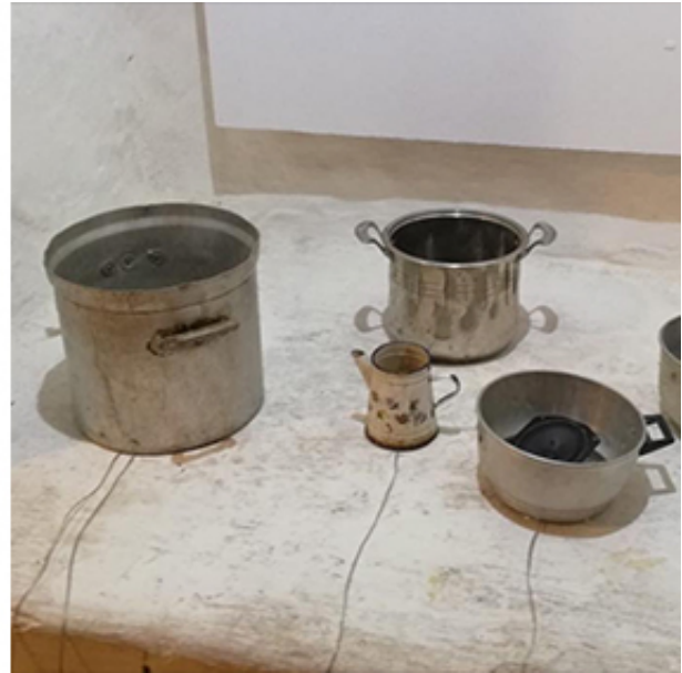
2018, sound installation, working progress, Al Jadida.

La compilation sonore « Territoire interdit » se compose de plusieurs enregistrements effectués par mounir fatmi lors de ses passages dans sa maison familiale de Tanger ainsi que dans les cuisines de plusieurs autres maisons voisines. Les prises de sons ont été réalisées dans cet espace traditionnellement réservé aux femmes, à sa mère et ses sœurs, et interdit au petit garçon qu'il était. Elles restituent les bruits produits par les ustensiles de cuisine marocaine et les conversations féminines autour des repas à préparer.