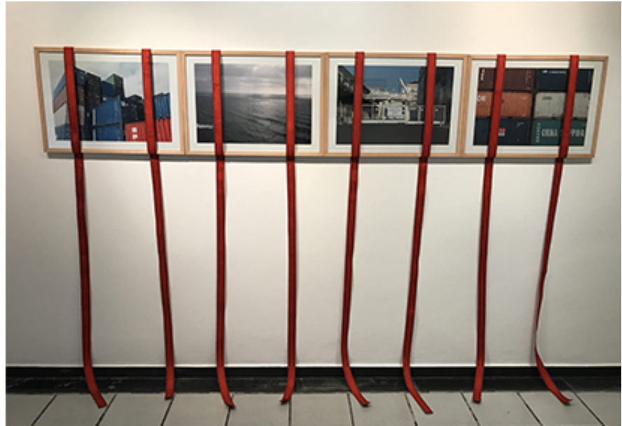
Series des photos commencée en 2013, rubans de transport orange. Exhibition view from Le Pavillon de l'Exile, Galerie Delacroix, 2017, Tanger. Ed. of 5 + 2 A.P.

« Le Pavillon de l'Exil » est une série de photographies en couleurs et en noir et blanc initiée en 2013, dont les cadres sont entourés de sangles d'arrimage de couleurs différentes. L'ensemble des photographies couleurs se constitue de compositions géométriques et multicolores obtenues à partir de conteneurs empilés les uns au-dessus des autres, et d'images d'immeubles d'habitation à l'abandon, désertés de leurs occupants et partiellement détruits.