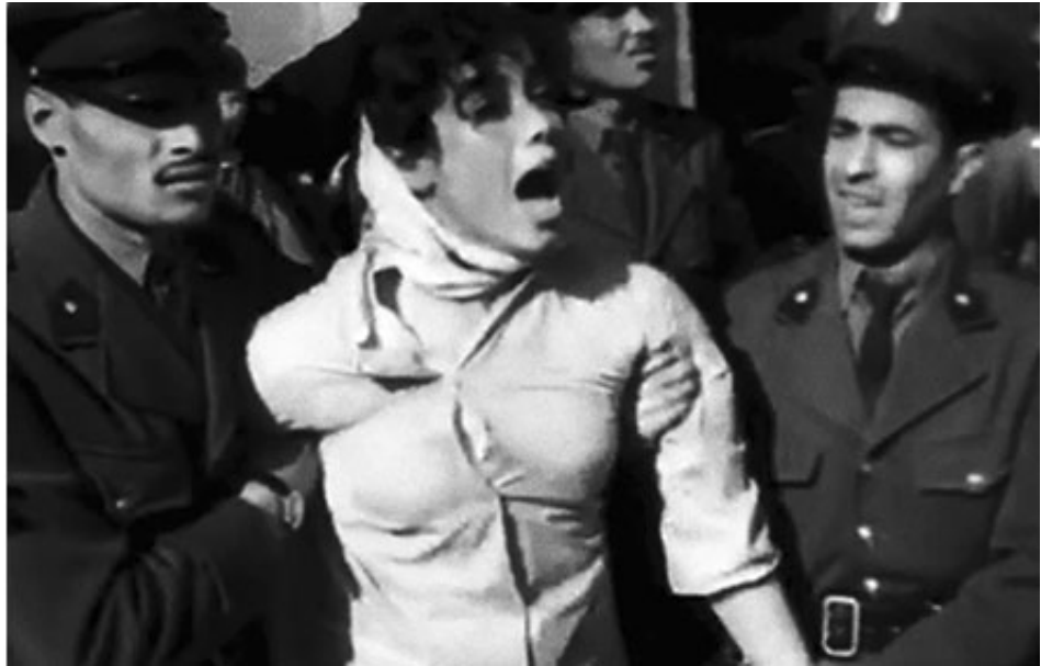
2016-2017, France, 11 min 33, HD, B&W, stereo. Courtesy of the artist and Ceysson & Bénétière, Paris. Ed. of 5 + 2 A.P.