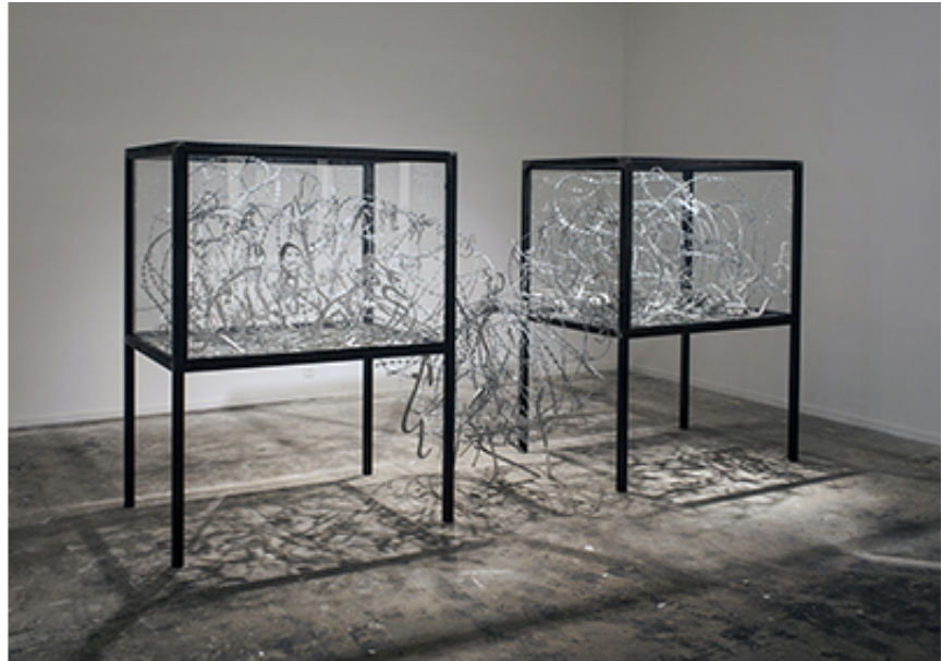
2016, Windows, barbed wire and calligraphies, 125 x 90 x 165 cm each. Exhibition view of A Savage Mind, Keitelman Gallery, 2016, Brussels. Courtesy of the artist and Ceysson & Bénétière, Paris. Ed. of 5 + 1 A.P.

Dead Language est une installation de mounir fatmi composée d'éléments de calligraphies arabes découpés dans des plaques métalliques, du fil barbelé et de deux vitrines en verre. Réunissant ainsi trois éléments qui sortent complètement de leurs contextes habituels. Le fil barbelé remplit l'espace vide des deux vitrines et passe de l'une à l'autre formant ainsi une frontière. Cet espace devenu infranchissable pour le public, l'oblige à reculer et appréhender l'installation dans son ensemble. Le spectateur tenu à distance par cette frontière, est aussi systématiquement invité à ne pas toucher l'œuvre.