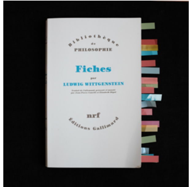
2016, 4-tracks sound installation, 10'05 min.

Les fiches de Wittgenstein est une installation sonore qui se déploie en quatre pistes.