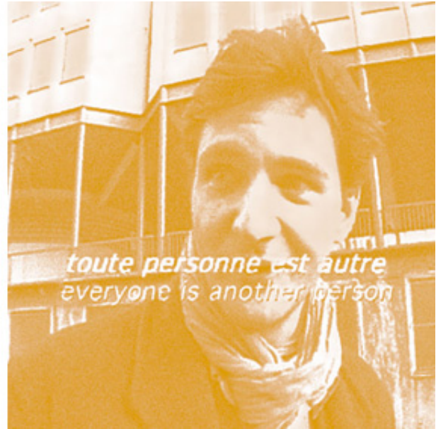
1999-2016, Sound installation, stereo, 6'27.