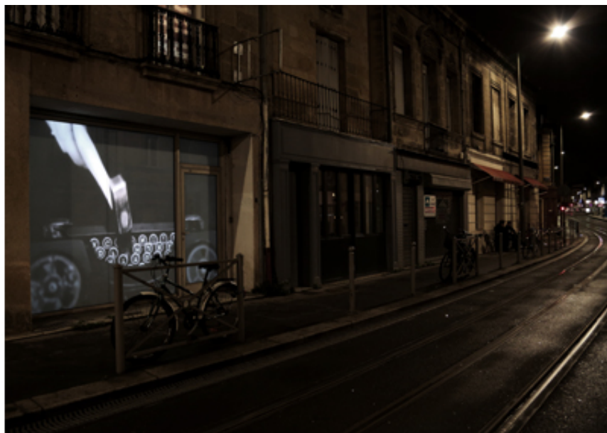
2013, France, 5 min, HD, colour, stereo. Size may vary, video projection. Exhibition view from History is not mine, metavilla, Bordeaux, 2015.

Malgré le contexte politique et les bouleversements récents qu'ont connu le Mali ainsi que l'Afrique du Nord avec les Printemps arabes ou, plus récemment, le Burkina Faso, la Biennale africaine de la photographie fait son retour et signe son édition anniversaire.